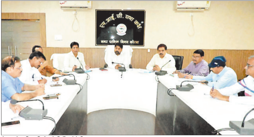
बैठक में अधिकारियों को निर्देश देते निगम आयुक्त।

निगम आयुक्त ने जेन कमिश्नरों व प्रभारी अधिकारियों को निर्देश दिया है कि समाधान शिविरों के आयोजन से पूर्व सुशासन तिहार के तहत प्राप्त सभी आवेदनों का संतुष्टिपूर्ण निराकरण सुनिश्चित कराएँ। उन्होंने कहा कि निगम के अतिरिक्त जिले के अन्य विभागों से संबंधित जो आवेदन प्राप्त हुए हैं, उन आवेदनों को संबंधित विभागों को निराकरण के लिए भेजे एवं विभागीय समन्वय बनाकर आवेदनों का निराकरण कराएँ।